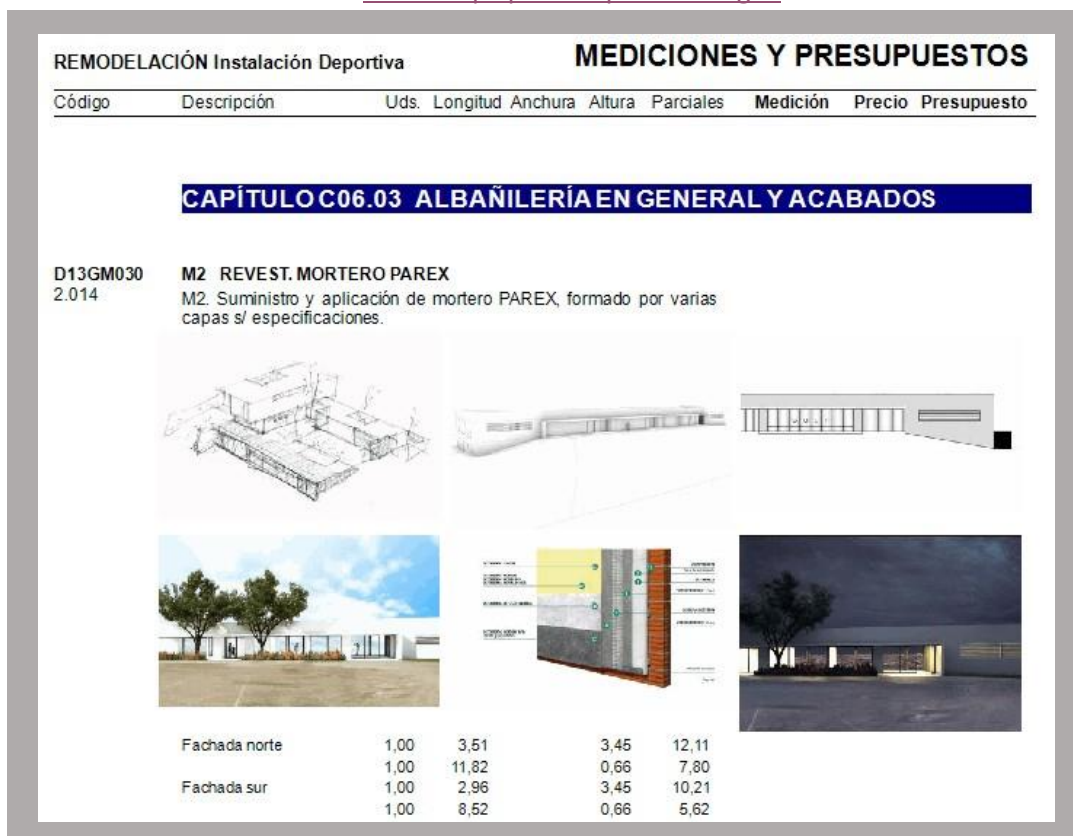
IMAGEN 1 (hojas del presupuesto)

Hoja del presupuesto del proyecto inicial al cual se le ha añadido a una partida imágenes aclaratorias y definitivas.